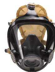
SureSeal System for AV-3000